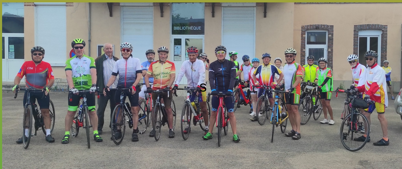
Départ d'un groupe, photo 2023

Par mail à charmoycyclotourisme.fr ou 06 83 20 25 93