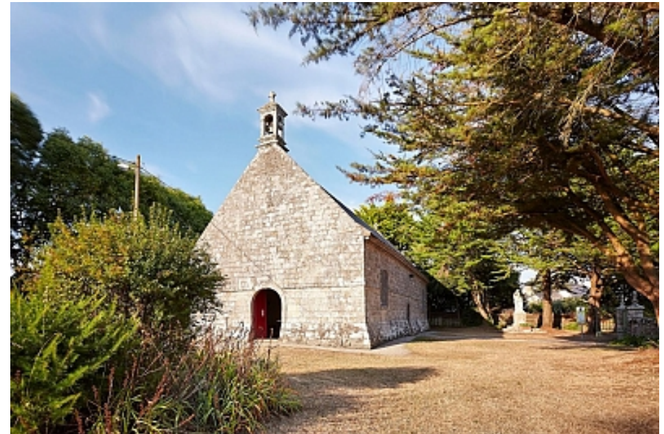
OTI Presqu'île de Rhuys

Pour les amoureux des vieilles pierres et du patrimoine religieux breton, la Presqu'île de Rhuys offre un beau circuit à la découverte des chapelles et à la rencontre de leur saint protecteur. La chapelle Saint-Jacques fut à l'origine construite à la pointe éponyme sur la commune de Sarzeau. Malheureusement le saint protecteur ne put rien contre les assauts de l'océan et l'érosion des sols. Au cours XIXe siècle, la chapelle s'effondra et fut reconstruite à Trévenaste. Son triptyque du peintre Joseph-François Gouézou (1867) présente en son centre un Christ ressuscité, pastiche de la Transfiguration de Raphaël.