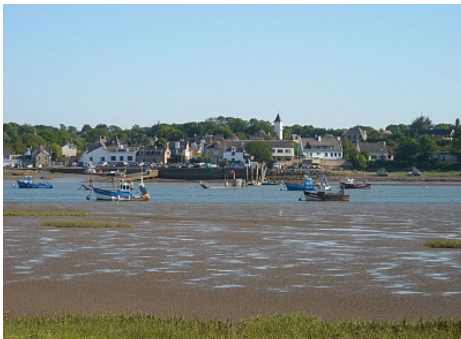
Tourisme Arc Sud Bretagne | Morbihan

En bord de Vilaine, le Moustoir (Moustoir est un petit ermitage en vieux français) possédait une chapelle aujourd'hui disparue. Ce site offre un point de vue sur La Vilaine et sur le village ostréicole de Tréhiguier en face. C'est un endroit idéal pour observer les oiseaux limicoles. C'est à partir du Moustoir que le circuit entre dans le domaine maritime.