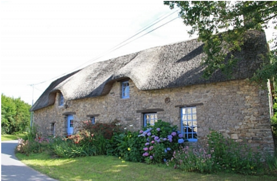
Tourisme Arc Sud Bretagne | Morbihan

Le circuit est proche du village de Bourgerelle qui conserve four et croix traditionnels ainsi que de nombreuses longères dont certaines sont encore couvertes en chaume aujourd'hui.