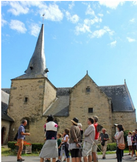
Tourisme arc Sud Bretagne

Le circuit traverse Lantern avec sa chapelle, classée aux Monuments Historiques, fondée par les Templiers au 12e siècle. Le village conserve de nombreuses maisons de notable des 16e et 17e siècles.