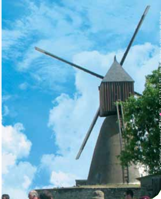
Création - Agence CREAN - 02 41 34 13 27 - Ne pas utiliser sur la voie publique.

Pour toute information sur les formules randonnées, contactez l'Agence de Développement Loire en Layon au 02 41 54 59 22 ou 06 46 16 59 52 sur : tourisme@layon.org