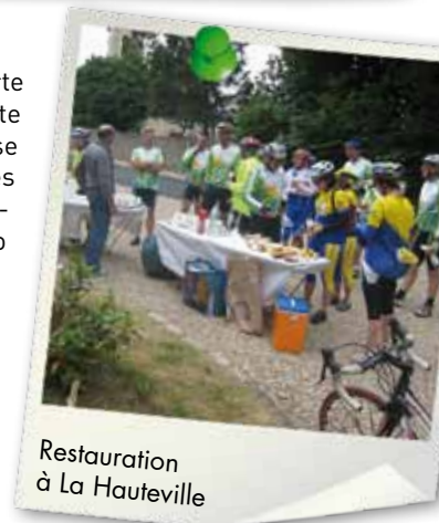
Restauration à La Hauteville

Le VCMB ne pourra être tenu pour responsable d'un quelconque incident ou accident qui pourrait porter préjudice matériel, physique ou moral à l'encontre des participants inscrits à cette randonnée.