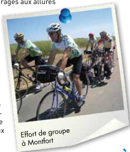
Effort de groupe à Montfort